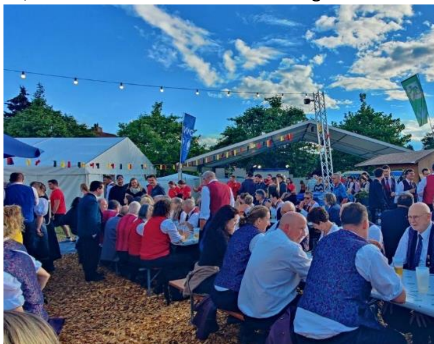
Wetter- und Stimmungswechsel am Nachmittag

Jedoch haben wir unser Ziel, mit einer guten Leistung im Mittelfeld abzuschliessen, erreicht. Mit den Bewertungen von 81 Punkten für das Pflichtstück und 83 Punkten für das Selbstwahlstück, was einer guten bis sehr guten Leistung entspricht, dürfen wir ebenfalls sehr zufrieden sein. Nach 23.00 Uhr ging es nach einem nassen, aber dennoch gelungenen Musikfest wieder zurück ins Oberland.