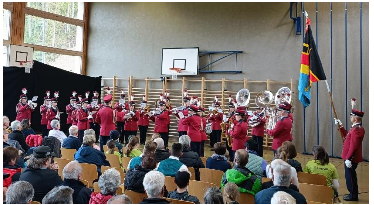
Die MG Reutigen bei der «Marschmusik» in der Turnhalle

Aufgrund des kühlen und regnerischen Wetters, wurde die Marschmusik in stehender Formation in der Turnhalle durchgeführt, was sich im Nachhinein nicht als Stärke der MG Reutigen herausstellte. Nach dem gemeinsamen Abendessen im Festzelt und der Rangverkündigung konnten wir das fröhliche Fest geniessen. Am Sonntagvormittag traten wir die rund vierstündige Heimreise an. Nach einem ungeplanten Zwischenstopp auf dem Festgelände, um ein verloren gegangenes Handy zu finden, und einem Mittagshalt an der Raststätte in Würenlos, kamen wir am Nachmittag wieder in Reutigen an.