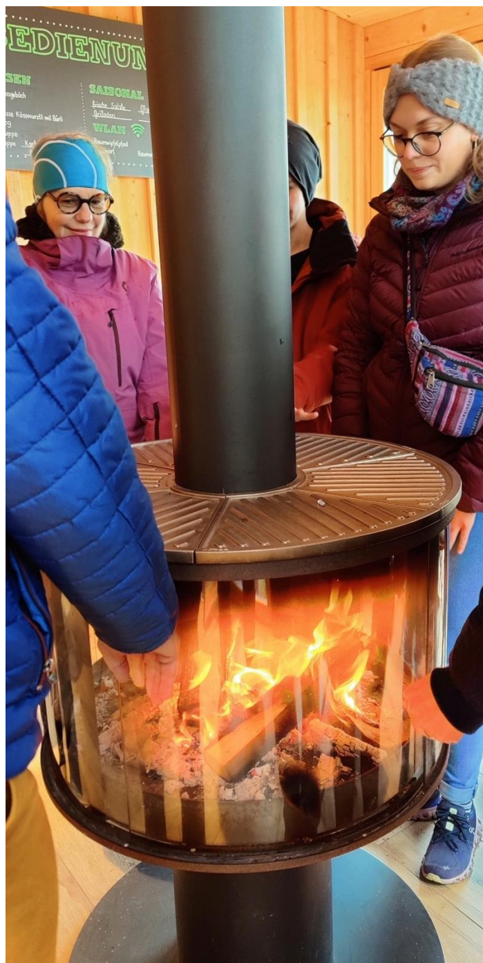
Eine willkommene Wärmequelle nach dem Rundgang auf dem Baumwipfelpfad

Einen ersten Halt legten wir in Tuferschwil im Restaurant Rössli ein, wo uns ein sehr leckerer Hackbraten mit Kartoffelstock und Gemüse serviert wurde. Gestärkt ging die Fahrt weiter zum Baumwipfelpfad Neckertal. Bei winterlichen Verhältnissen wurden wir in zwei Gruppen durch die Baumwipfel geführt und über Besonderheiten der Tier- und Pflanzenwelt informiert. Am späteren Nachmittag trafen wir im Hotel Wolfensberg in Degersheim ein. Zeit zum Ausruhen blieb uns hier allerdings nicht. Kurze Zeit später brachte uns der Car zum Oberstufenzentrum Necker. Nach einem gelungenen Konzert unsererseits, konnten wir den Abend mit einem Abendessen und musikalischer Unterhaltung der Musikgesellschaften Ursenbach und Mogelsberg bei gemütlichem Beisammensein ausklingen lassen. Am Samstagmorgen genossen wir ein leckeres Frühstück und bereiteten uns mit einer Vorprobe im Hotel auf unsere Auftritte am Kreismusiktag vor. Anschliessend fuhren wir erneut nach Necker, wo wir nach dem Einspielen unseren Konzertvortrag zum Besten gaben. Die anschliessende Beratung durch einen Experten gab uns einige Hinweise, worauf wir in der musikalischen Gestaltung noch stärker den Fokus legen können.