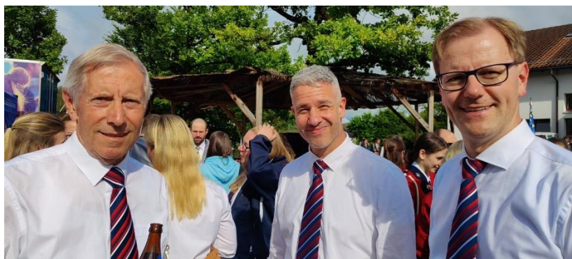
Ausgelassene Stimmung nach dem Konzertvortrag

Wir besammelten uns für das Einspielen, und begaben uns gedanklich langsam in die nötige Konzentration für unseren Auftritt um 17.10 Uhr. Die Vorträge unserer Konkurrenz stimmten uns mutig und wir waren motiviert, dass wir dem Niveau entsprechend mithalten können. Mit dem Verlauf unseres Auftrittes waren wir alles in allem sehr zufrieden. Es gelang eine uns zufriedenstellende Version und wir waren mit Freude dabei. Auch der Funken zum Publikum schien gemäss Rückmeldungen rübergesprungen zu sein. Während des Nachmittags verzogen sich auch die Regenwolken und wir konnten sogar draussen an der Sonne mit einem Bier auf unseren Auftritt anstossen. Die Zeit stand wieder zur freien Verfügung und viele