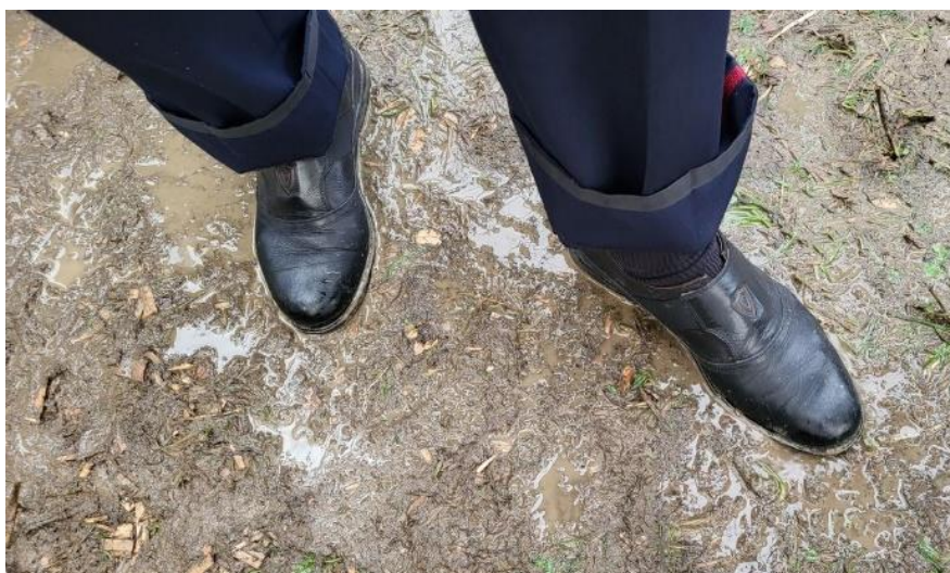
Kein Schuh blieb an diesem Tag trocken

Festes dazu, die Parademusik für diesen Tag nicht weiter durchzuführen. So verging keine Stunde, bis die ersten Jasskarten aus dem Musikkittel gezupft wurden. Zeit war genügend da. Nebst dem Mittagessen war unsere nächste offizielle Besammlung erst wieder am späten Nachmittag für den Konzertvortrag. Nebst dem Kartenspielen nutzten wir die Zeit, um uns andere Konzertvorträge anzuhören oder auch um das Kaffee- und Kuchenzelt zu besuchen. Beim Mittagessen im Festzelt wurde übrigens unser Sehsinn und Tanztalent herausgefordert. Nicht etwa um das Essen zu inspizieren oder die Tanzbühne einzuweihen, sondern um geschickt die grössten Schlammgräben zu umgehen. Das Zelt stand leicht an einem Hang, und der Boden war derart durchtränkt, dass sich überall dort, wo zuvor keine Holzschmitzel gestreut wurden, der Boden in einen Brei aus Schlamm verwandelt wurde. Die Uniformhosen waren schnell raufgekremgelt, der Rest wurde vor dem Auftritt am Waschbecken in Ordnung gebracht. Gegen 16.00 Uhr wurde es dann langsam ernst.