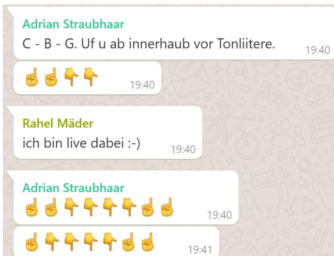
Einspielen vor dem Konzert

Es gab aber auch Highlights während der schwierigen Zeit, in welcher keine Musikproben stattfanden. Innerhalb unserer WhatsApp-Gruppe blieb man trotz Lockdown in Kontakt und so konnte beispielsweise das Konzert und Theater trotz physischer Abwesenheit doch noch 1:1 miterlebt werden 😊.