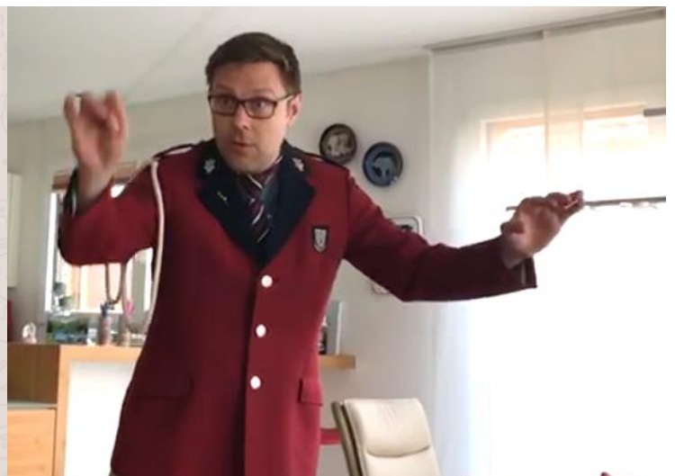
Volle Konzentration während des Konzerts per Video