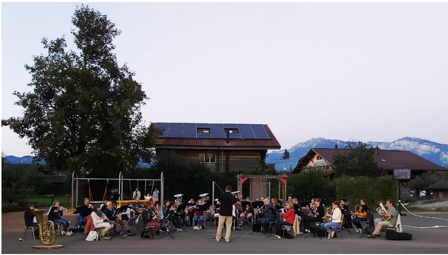
Platzkonzert im September

Dabei kam auch die Idee auf, ein Platzkonzert auf dem Schulhausplatz durchzuführen, da dort die Abstände für das Publikum bestens eingehalten werden konnten.