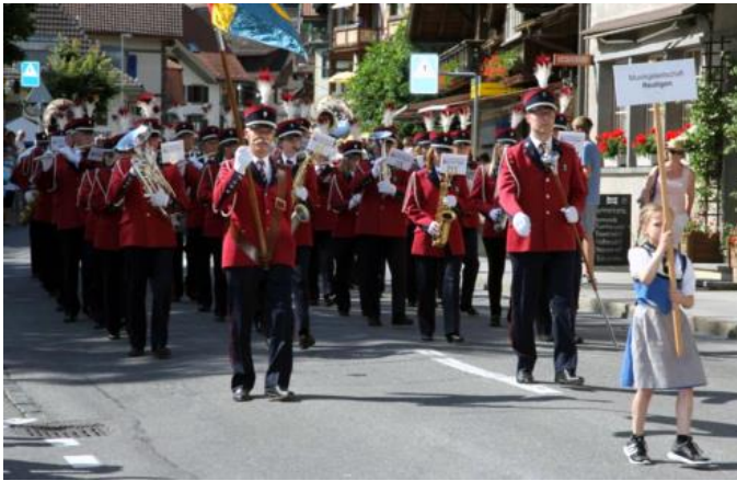
Die MG Reutigen während der Marschmusik

Auch die dreiköpfige Jury zeigte sich beeindruckt und kürte die Darbietung der MG Reutigen mit Rang eins.