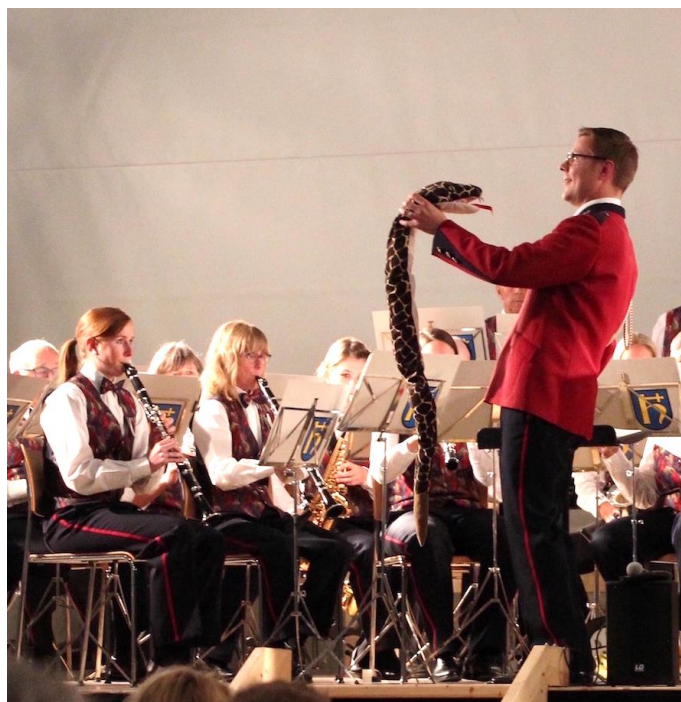
Ausschnitt aus dem Showblock

Die acht teilnehmenden Vereine begeisterten das Publikum mit einem unterhaltsamen Programm. Von einer Bahnreise auf den Niesen, einem Fernsehabend, einer lebenden Jukebox, dem Vogellisi-Ohrwurm, einem Krimi bis hin zu einem sportlichen Werbespot kamen wohl alle Zuhörerinnen und Zuhörer auf ihre Kosten.