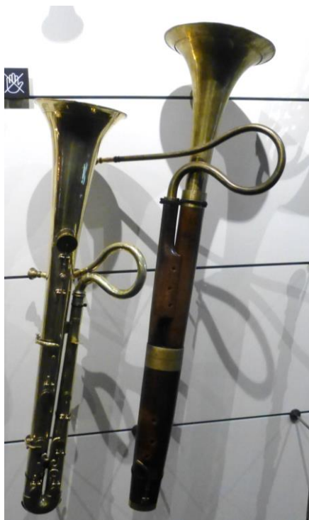
Ophikleide (links) und Basshorn (rechts)

Am 16. September 2017 wagte sich die MG Reutigen wieder einmal in die grosse Stadt. Ein Ausflug nach Bern stand auf dem Programm. Mit Bus und Bahn gelangten 18 Personen in die Altstadt von Bern, wo wir uns erstmals mit Speis und Trank im Café Gfeller stärkten.